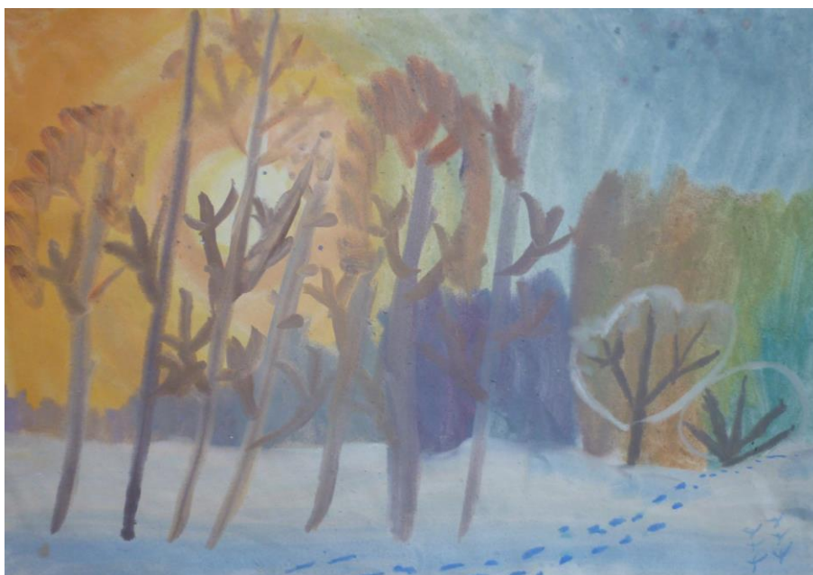
Зимнее солнце Козменков Даниил, 7 лет