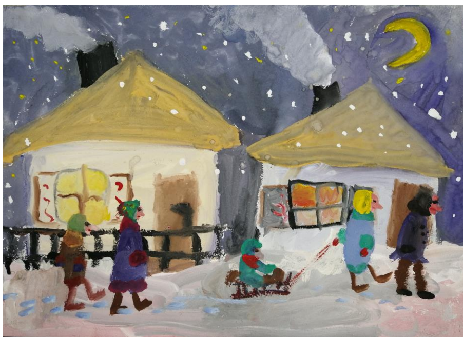
Вечер на хуторе Фомина Ульяна, 6 лет