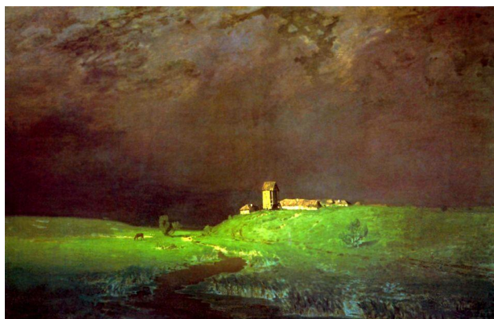
А.И. Куинджи «После дождя»