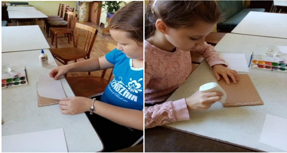
Рис.1. Подготовка основы.

Затем берем дощечку и наносим на нее разноцветные мазки краской при помощи кисти. Краска на пластмассовой доске перемешивается, образуя единое цветное пятно.