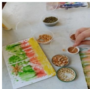
Рис.4 Изготовление цветов из семян растений.

После того как мы подготовили фон, берем семена растений и приклеиваем их в виде цветов. Здесь наша фантазия безгранична. Цветочки могут быть разной формы, разного размера. У нас получается цветочная полянка.