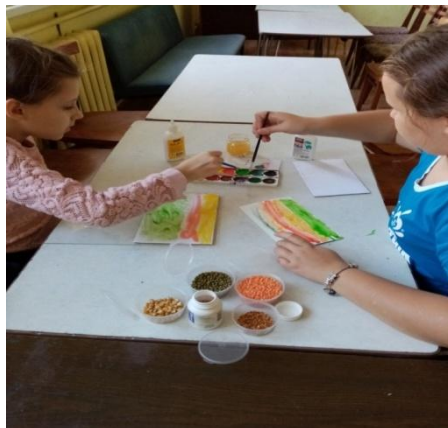
Рис.2. Нанесение краски на дощечку.

Затем берем дощечку и наносим на нее разноцветные мазки краской при помощи кисти. Краска на пластмассовой доске перемешивается, образуя единое цветное пятно.