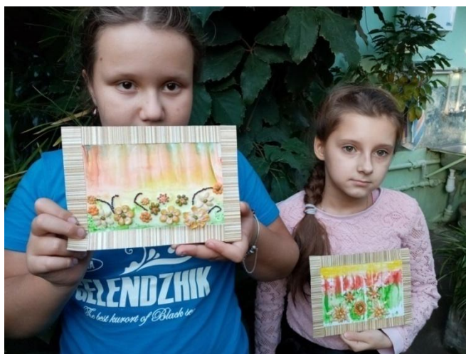
Рис.5. Готовые работы.

4.Подведение итогов. Из готовых работ можно сделать мини выставку.